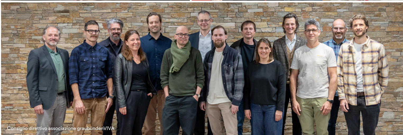
Consiglio direttivo associazione graubündenVIVA