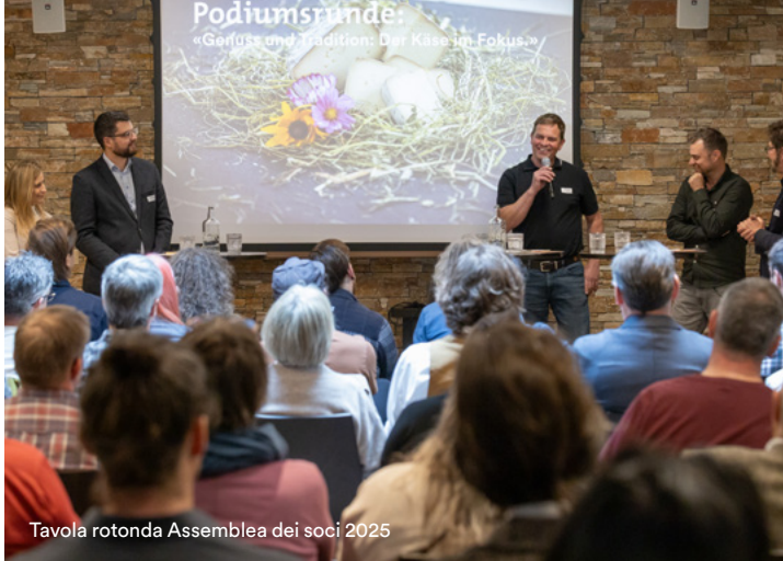
Tavola rotonda Assemblée dei soci 2025